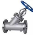
Y- Globe Valve